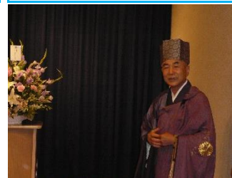
商工葬祭様、 桐田住職 ありがとうございました！

例会場 魚庄別館 2F 事務所 蓮田市西新宿1-48-1 例会日 水曜日 12:30~13:30 TEL 080-9396-9810 FAX 048-720-8227 e-mail hasudarc@gmail.com http://www.hasuda-rotaryclub.com/