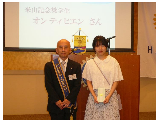
先月と状況の変わりはありませんが、がんばります!