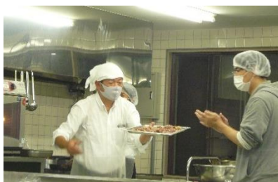
栗一商店自慢のお肉です！