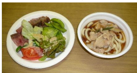
『熊本和牛のサーロイン&肉汁うどん』