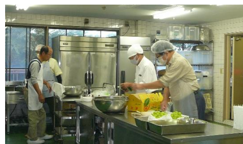
楽しんで準備設営がんばりました！